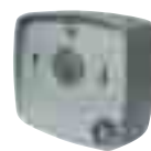
Selector P-5/0 P-5/0 Selector Sélecteur P-5/0