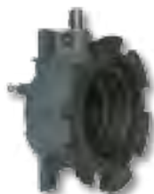
Caja de transmisión Transmission box Boîtier de transmission